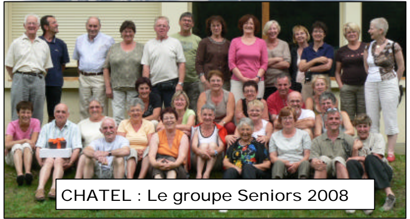
CHATEL : Le groupe Seniors 2008