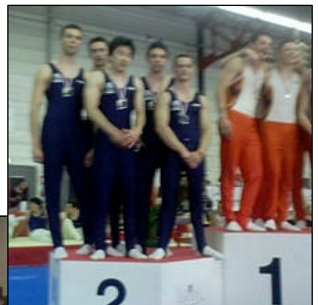
Cholet : Equipe DF B2